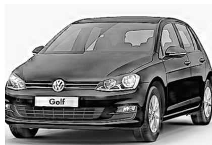
Die neue Rosenkönigin darf zwei Jahre lang einen neuen Golf VII im Wert von 33 500 Franken von der Multimotor Garage AG in Siebnen fahren.

Und es gibt eine ganze Reihe von attraktiven Preisen im Gesamtwert von nicht weniger als 40 000 Franken zu gewinnen. Als Hauptpreis steht der neuen Rosenkönigin für beide Amtsjahre ein perlend schwarzer Golf VII von der Multimotor Garage AG in Siebnen zur Verfügung. Also jener nigelnagelneue Golf, der eben erst seine Weltpremiere feierte und in der