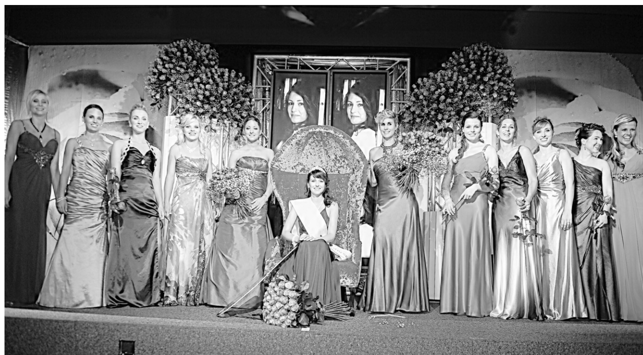
Die Rosengala bleibt für alle Finalistinnen ein unvergessliches Erlebnis – auf der Suche nach der neuen Rosenkönigin sind nicht zuletzt auch Märchlerinnen und Höfnerinnen gefragt, die Anmeldefrist läuft ab sofort.