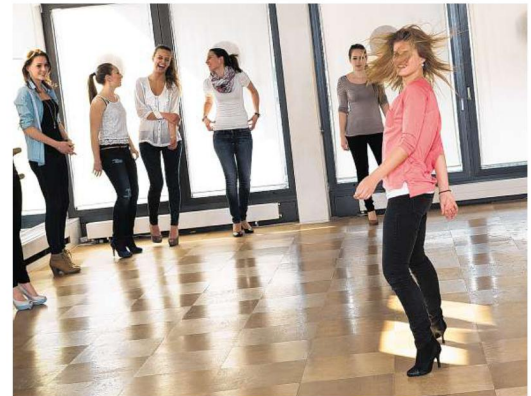
...und die Rosenprinzessinnen setzen das Gelernte gleich mit viel Eleganz und noch mehr Spass um.