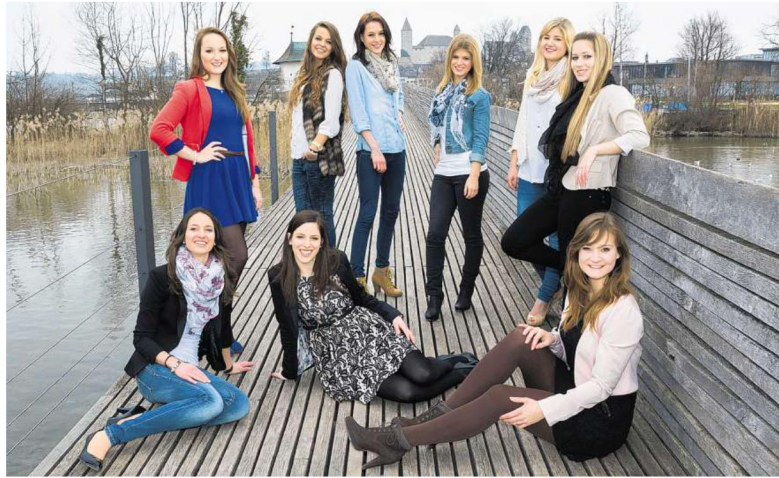
Vorne die Rosenprinzessinnen, im Hintergrund das Schloss – Welch stimmige Kulisse!

Bis zur Rosengala am Samstag, 15. Juni, bleibt noch etwas Zeit, sich vorzu-