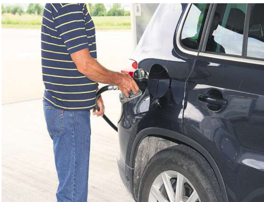
Die Anzahl Benzindiebstähle an den Tankstellen hat auch in der Oberseeregion zugenommen.

Dank den Videoüberwachungskameras an den Tankstellen können viele Täter später eruiert und auf das Versäumnis aufmerksam gemacht werden. Die meisten bezahlen anstandslos – und damit ist die Sache erledigt. Wer sich jedoch weigert, der wird angezeigt. Seite 3